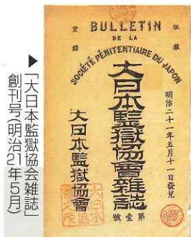
▶「大日本監獄協会雑誌」 創刊号(明治21年5月)