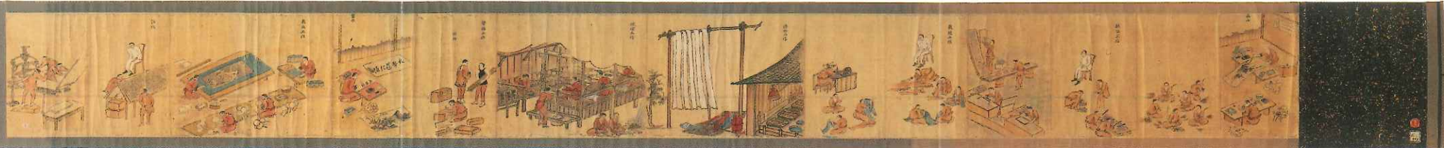
▲「石川島監獄著作業状況図」