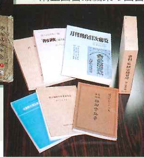
▼矯正図書館編集の図書