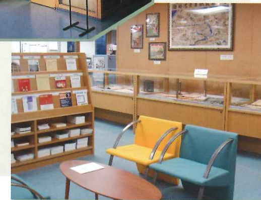
▼ 史料展示コーナー 新刊雑誌コーナー