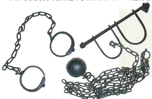
◀ 行刑史料 (江戸期・明治期の戒具)

矯正協会の会員は、刑務所、少年院、少年鑑別所などの矯正施設に勤務する者(矯正職員)及び勤務した者、また矯正協会の活動の趣旨に賛同して活動を援助する者(賛助会員)によって構成されており、矯正協会の事業は、主として会員の拠出する会費収入と各種の事業収入によって運営されています。