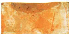
▲東京集治監製造の煉瓦(桜刻印)